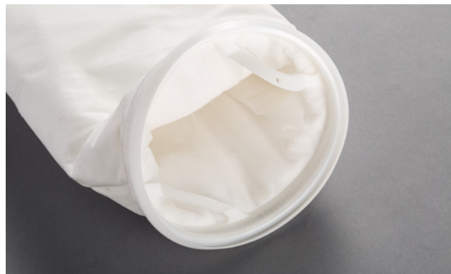
超长寿命滤袋产品细节图

HBV 过滤袋所采用的材料均符合美国以及欧洲法规中适用于食品以及饮料接触的条例。