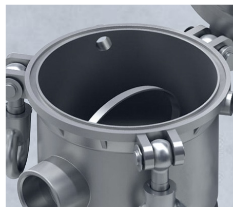
经济型袋式过滤器产品细节图