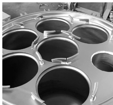
快开式袋式过滤器产品细节图